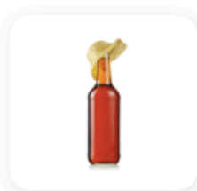
1 cuillère à soupe de rum