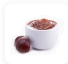
6 cuillères à soupe de crème de marrons