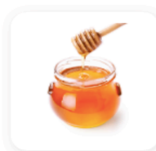
2 cuillères à soupe de miel