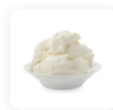
250 g de mascarpone